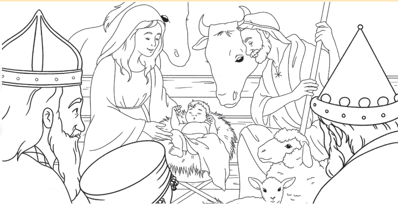
Tegning: Alessandro Coppola og Lorenza De Luca

Gi barnebladet Barnas til et barn du er glad i!